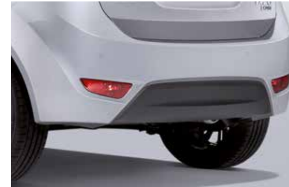
Zadné parkovacie senzory. Cúvanie v tesnom priestore uľahčujú zadné parkovacie senzory, akusticky indikujúce vzdialenosť od prekážky.

Interiér si môžete nakonfigurovať na prepravu osôb, nákladu alebo na kombináciu oboch. Inteligentný mechanizmus fold & dive umožňuje sklopiť operadlo zadného sedadla, delené v pomere 60 : 40, do podlahy tak, že sa vytvorí batožinový priestor s objemom až 1 486 litrov. Novú ix20 poháňajú zdokonalené benzínové a naftové motory, ktoré sú k dispozícii s 5- alebo 6-stupňovou manuálnou prevodovkou alebo s novou 6-stupňovou automatickou prevodovkou. Ďalšie praktické prvky ako zadné parkovacie senzory a cívacia kamera uľahčujú každodennú jazdu a znižujú stres.