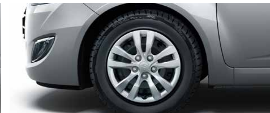
15-palcové oceľové disky