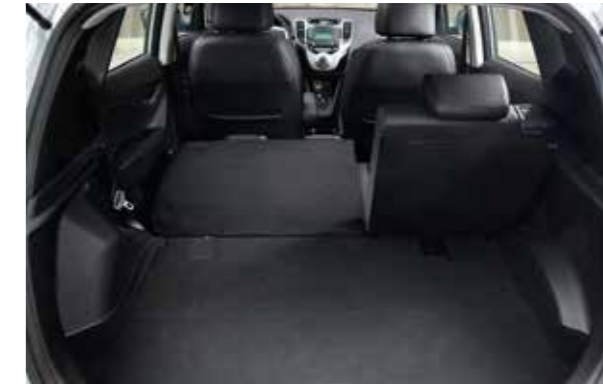
Variabilný batožinový priestor. Batožinový priestor má veľký základný objem 440 litrov pod sťahovacím krytom. Posuvné zadné sedadlo umožňuje zväčšiť objem batožinového priestoru pri preprave rozmerných predmetov.