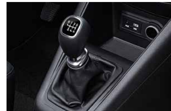
Šesťstupňová prevodovka. Naftové motory majú 6-stupňovú manuálnu prevodovku rovnako ako benzínový motor 1,6 litra, ktorý môže byť na želanie vybavený aj novou, vysoko účinnou 6-stupňovou automatickou prevodovkou.