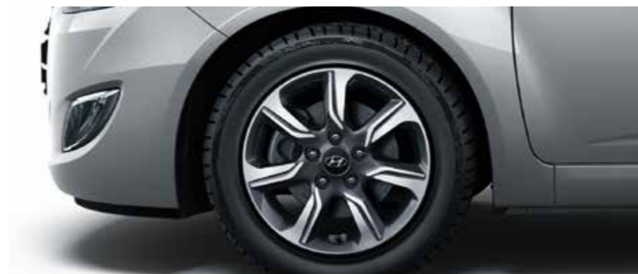
16-palcové zliatinové disky