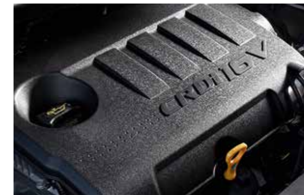
Zdokonalené motory. Benzínové aj naftové motory boli modifikované na zníženie spotreby paliva, dva naftové motory majú zvýšený krútiaci moment. Všetky motory spĺňajú emisnú normu Euro 6.