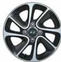
14" zliatinový disk s 8-lúčovým dizajnom (metalicky sivý)