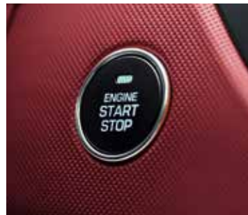
Tlačidlo na štartovanie/vypínanie motora. Ak ste v kabíne s kľúčom smart key vo vrecku alebo v taške, motor môžete pohodlne naštartovať stlačením gombíka.