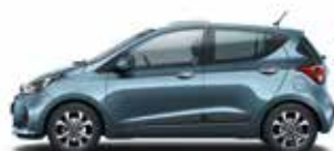
Aqua Sparkling (metalizovaný lak)