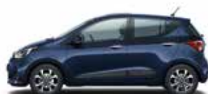
Morning Blue (štandardný lak)