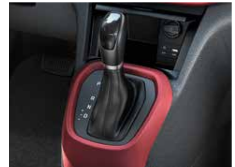
4-stupňová automatická prevodovka. Komfortne radiaca automatická prevodovka znižuje stres v hustej mestskej premávke.