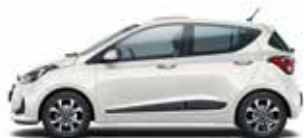
Polar White (štandardný lak)

Skombinujte si farby karosérie, kolesá a farby interiéru a vytvorte si váš ideálny nový Hyundai i10.