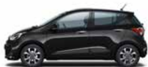
Phantom Black (perleťový lak)