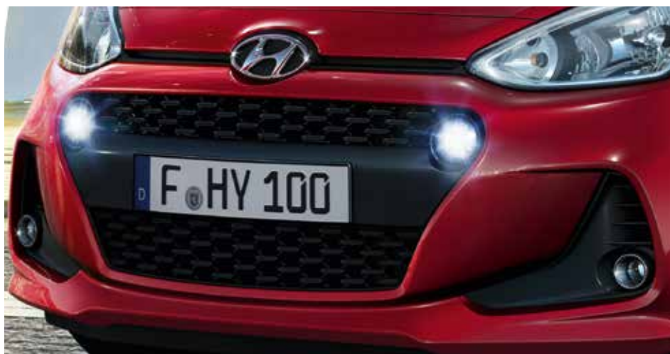
Kaskádovitá maska. Expresívny tvar novej kaskádovitej masky chladiča podporuje sebavedomý charakter i10.

Známy tvar i10 dostal nový športový vzhľad, ktorým okamžite zaujme. Má nový predný nárazník s novou kaskádovitou maskou chladiča s dennými svetlami. Dizajn dotvárajú nové kolesá, kontrastný panel v zadnom nárazníku a reštýlizované zadné skupinové svetlá.