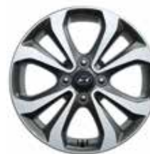
15" zliatinový disk so 4 dvojitými lúčmi (metalicky sivý)