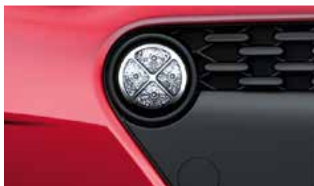
Denné svetlá z LED. Nové kruhové denné svetlá z LED dodávajú prednej časti i10 športový nádych.