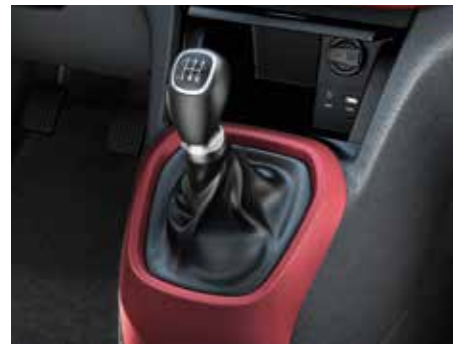
5-stupňová manuálna prevodovka. Presné radenie zvyšuje pôžitok z jazdy najmä na vidieckych cestách.