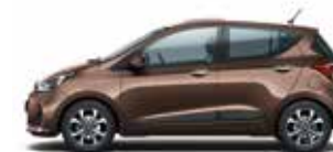
Cashmere Brown (metalizovaný lak)