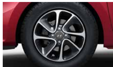
Nové kolesá. Športové 14-palcové zliatinové disky prispievajú k výraznému vzhľadu nového i10.