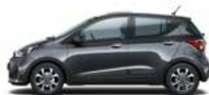
Star Dust (metalizovaný lak)