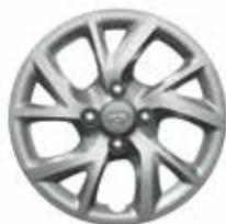
14" kryt ocelového disku s 5 dvojitými lúčmi (metalicky sivý)