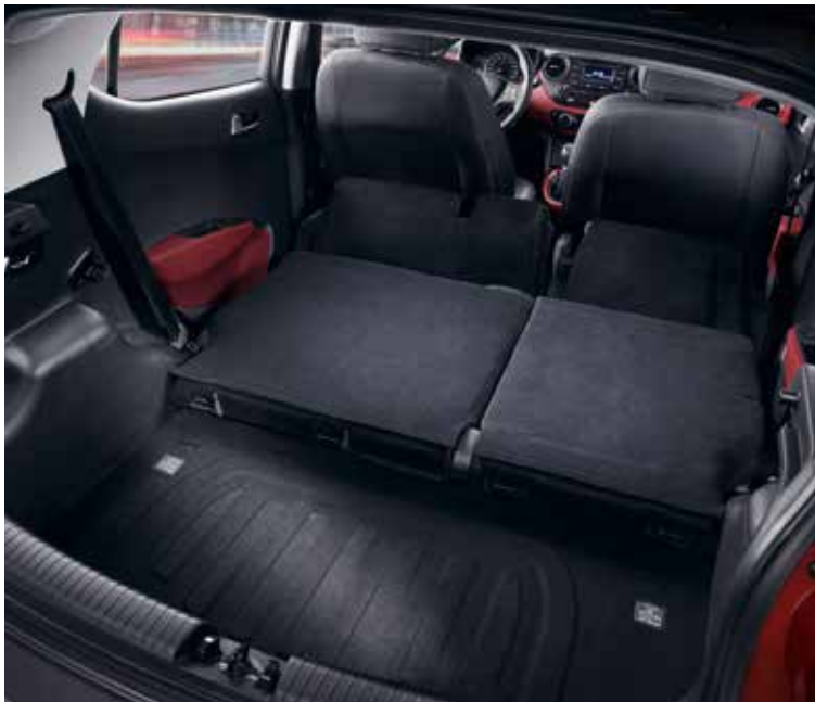
Batožinový priestor. Hyundai i10 má jeden z najväčších batožinových priestorov v triede. Základný objem 252 litrov sa dá sklopením zadných sedadiel zväčšiť až na 1 046 litrov.

Je neuveriteľné, koľko priestoru nájdete v i10. Jeho batožinový priestor patrí k najväčším v triede a v kabíne je miesto pre päť osôb. S vyhrievaným volantom, automatickou klimatizáciou, vyhrievanými prednými sedadlami a s mnohými praktickými odkladacími možnosťami je i10 jedným z najlepšie vybavených automobilov vo svojej triede.