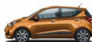
Mandarin Orange (perleťový lak)