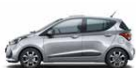
Sleek Silver (metalizovaný lak)