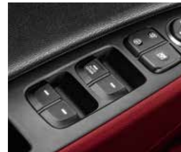
Elektricky ovládané okná vzadu. Nezvyčajným prvkom v tejto triede sú elektricky ovládané zadné okná.