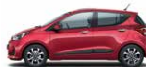
Passion Red (perleťový lak)