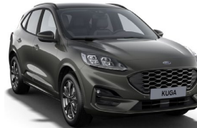
Magnetic Grey metalická