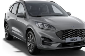
Solar Silver metalická