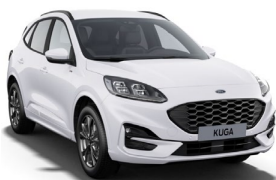
Frozen White nemetalická