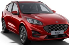
Lucid Red metalická