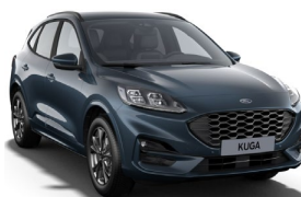
Blue Metallic metalická