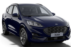
Blazer Blue nemetalická