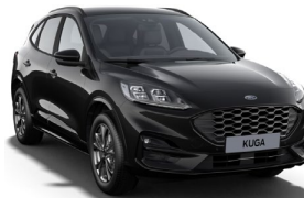
Agate Black metalická