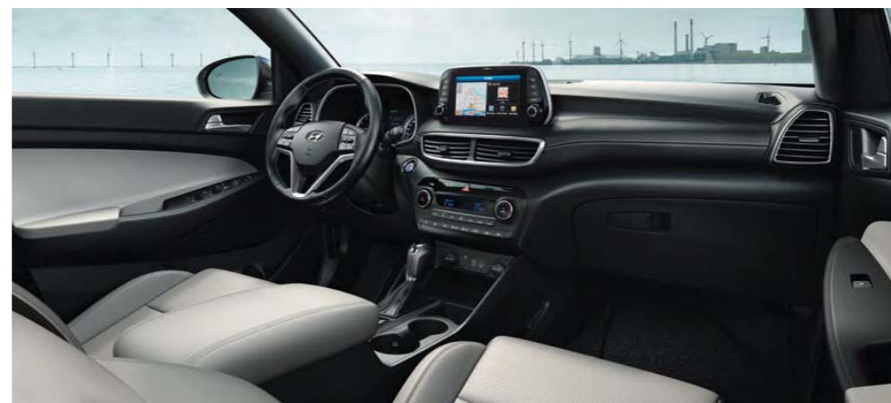
Svetlošedý / Light Grey