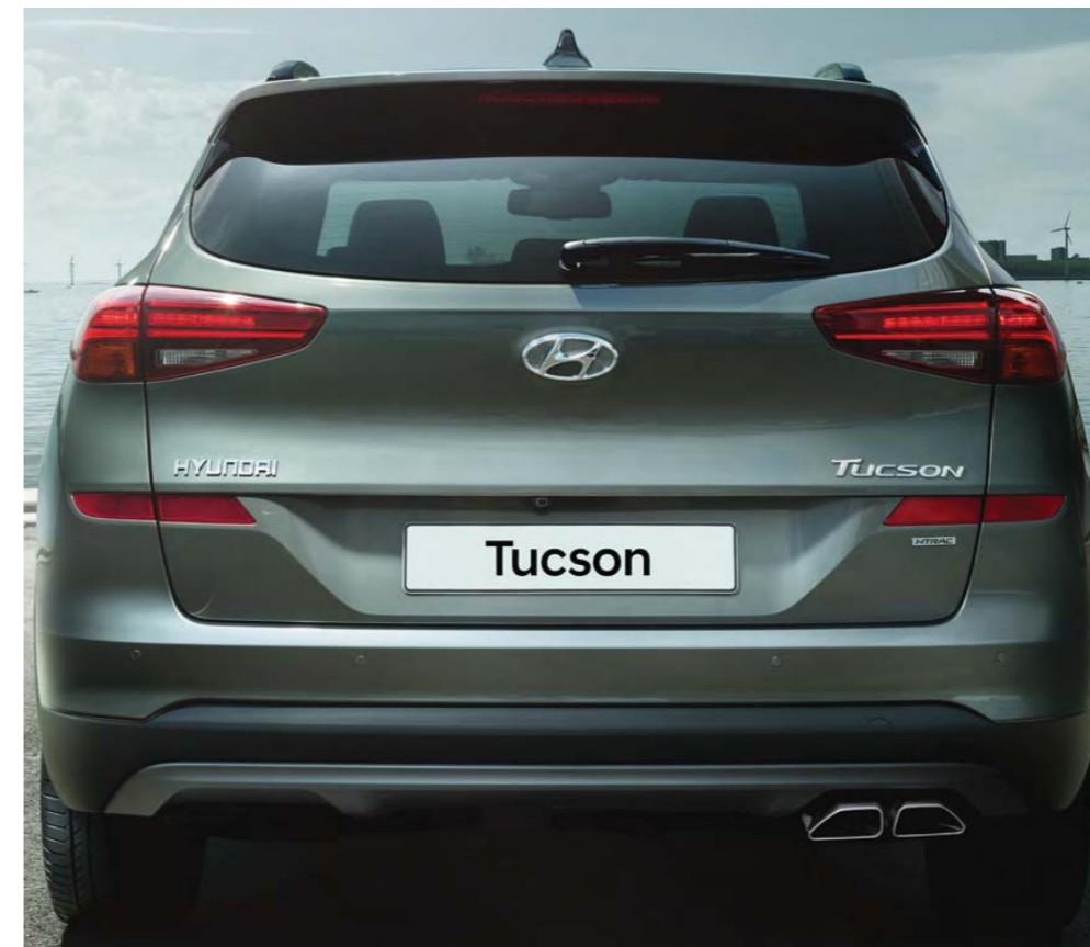
Reštýlizovaný zadný nárazník a nové LED zadné skupinové svetlá