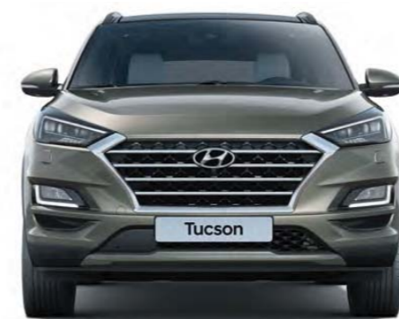
1 604 mm 1 850 mm