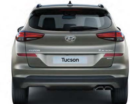
1 615 mm