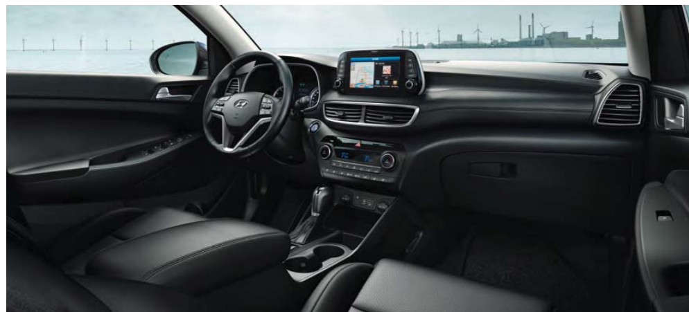
Čierny / 1-tónový