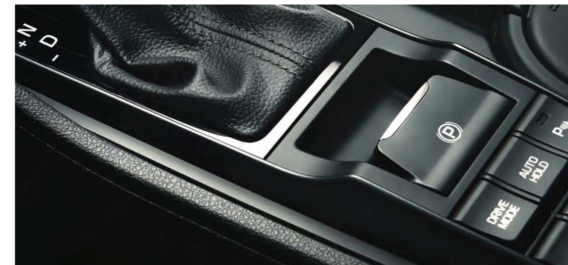
Elektrická parkovacia brzda

Nový Tucson poskytuje rozšírenú škálu inteligentných funkcií a systémov, ktoré zvyšujú pohodlie každého člena posádky. Elektrickú parkovaciu brzdú môžete ovládať jedným prstom – a v ušetrenom mieste na stredovej konzole je priehradka na bezdrôtové nabíjanie smartfónu. Pre jednoduchšie a bezpečnejšie parkovanie vám systém monitorovania okolia SVM poskytuje pohľad okolo vozidla v okruhu 360°. Navigačný systém je vybavený mapami celej Európy, ktoré môže zobrazovať v 3D, a zahŕňa na päť rokov predplatené služby LIVE Services, poskytujúce dopravné informácie a správy o počasi v reálnom čase, ako aj informácie o stacionárnych radaroch – v štátoch, kde je to zákonom povolené – tak ste neustále v správnom kurze a obraze.