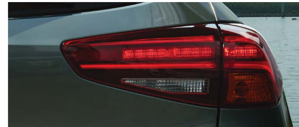
Nové LED zadné skupinové svetlá Nová zdvojená chrómovaná koncovka výfuku