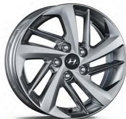
16" disk z ľahkej zliatiny