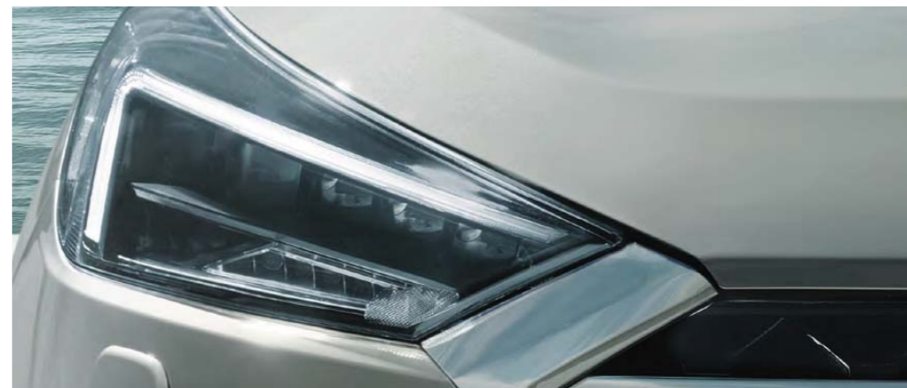
Nové svetlomety full LED s automatickým prepínaním diaľkových svetiel