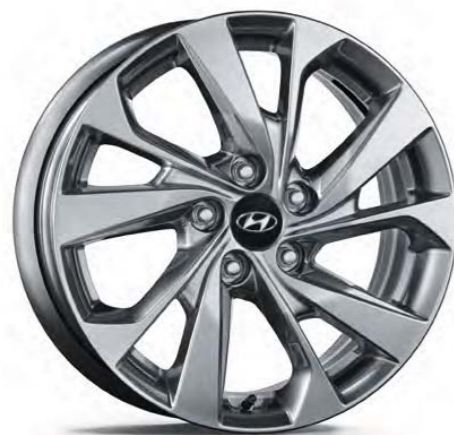
17" disk z ľahkej zliatiny