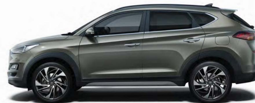
2 670 mm 4 480 mm