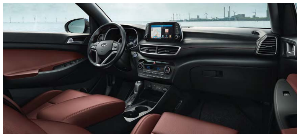
Červený / Red Wine