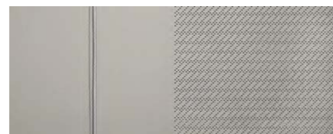
Látka / Light Grey