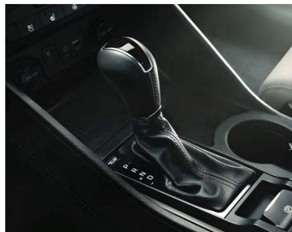
6-stupňová manuálna prevodovka (MT) 7-stupňová dvojspojková prevodovka (DCT) 8-stupňová automatická prevodovka (AT)