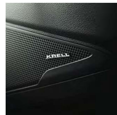
Prémiový ozvučovací Audiosystém