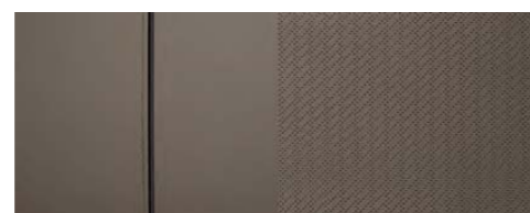
Látka / Sahara Beige