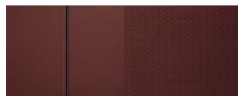
Látka / Red Wine