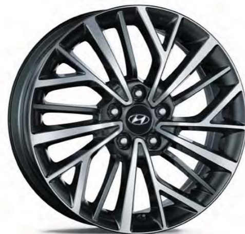
18" disk z ľahkej zliatiny (nový)