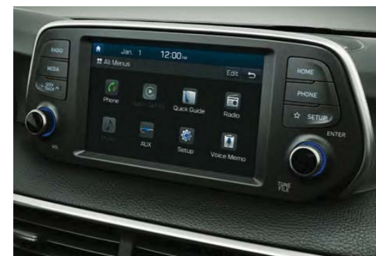
Rádio s farebným dotykovým displejom LCD 7" (17,8 cm) s Apple CarPlay™ a Android Auto™