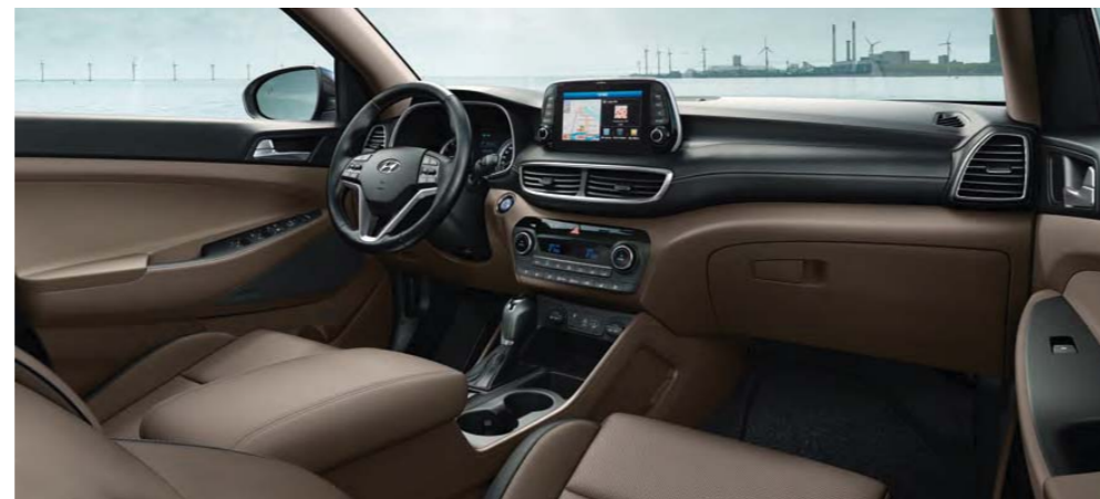
Béžový / Sahara Beige