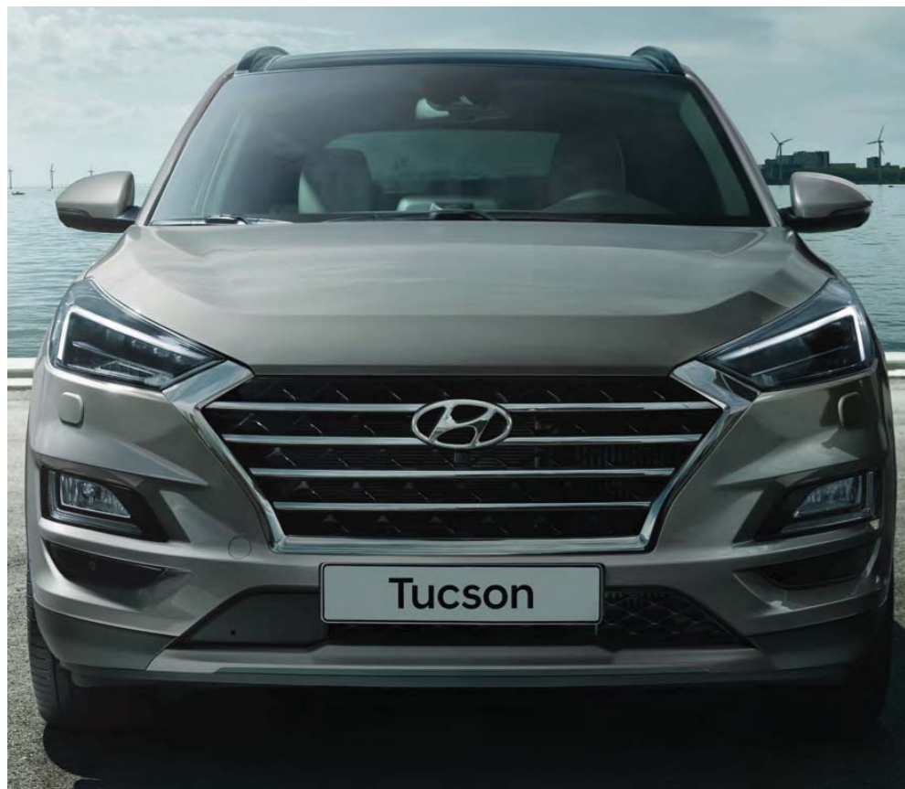
Charakteristická kaskádovitá maska Hyundai

S novými, výraznými prvkami dizajnu nový Tucson upúta na prvý pohľad.