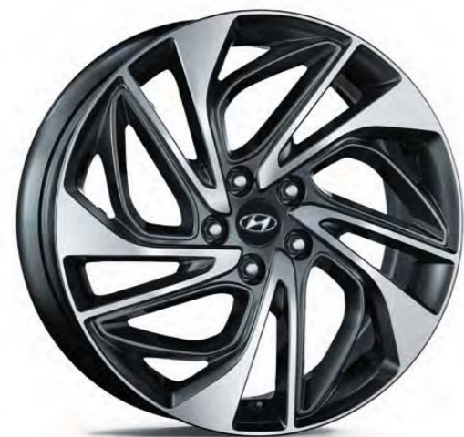
19" disk z ľahkej zliatiny