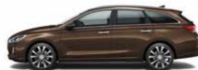
Demitasse Brown (metalizovaný lak)