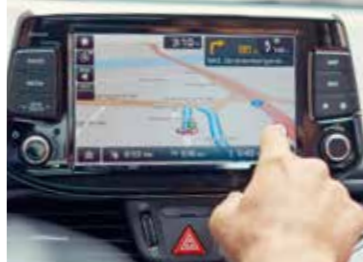
Dotykový monitor s uhlopriečkou 20,3 cm (8")