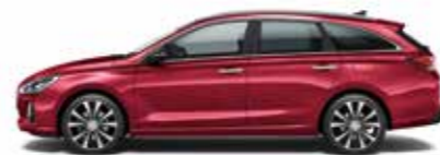
Fiery Red (metalizovaný lak)