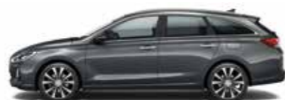
Micron Grey (metalizovaný lak)