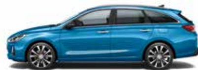
Ara Blue (metalizovaný lak)