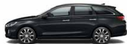
Phantom Black (perleťový lak)