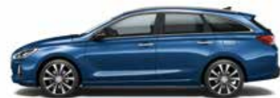
Stargazing Blue (perleťový lak)