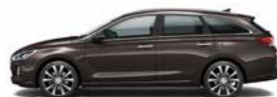
Moon Rock (metalizovaný lak)