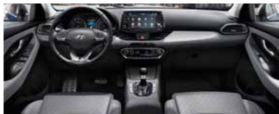
Dvojfarebný čierno-sivý interiér