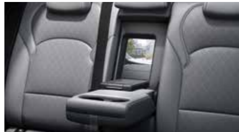
Stredová lakťová opierka s dvierkami na prstrčenie lyží