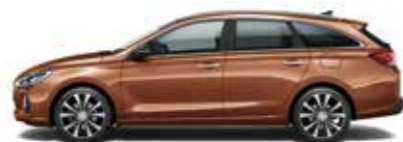
Intense Copper (metalizovaný lak)