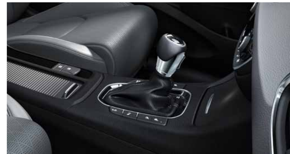
7-stupňová automatická prevodovka DCT s dvomi spojkami

Nové turbokompresorom prepíňané benzínové motory a 7-stupňová prevodovka DCT s dvomi spojkami zabezpečujú vysokú dynamiku nového i30 kombi. Medzi nimi vyniká nový benzínový štvorvalec 1.4 T-GDi, ktorý dosahuje vysoký výkon 103 kW (140 k). K dispozícii je aj nový benzínový trojvalec 1.0 T-GDI s výkonom 88 kW (120 k) a turbodiesel 1.6 CRDi v dvoch rozličných výkonových verziách s 81 a 100 kW (110 a 136 k). Moderné motory spolu s presným riadením, agilným podvozkom a karosériou z ocele s ultravysokou pevnosťou prispievajú k vysokej úrovni pôžitku z jazdy.