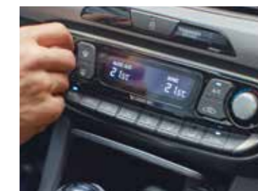
Dvojzónová automatická klimatizácia