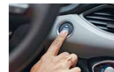
Tlačidlo na štartovanie/ vypínanie motora