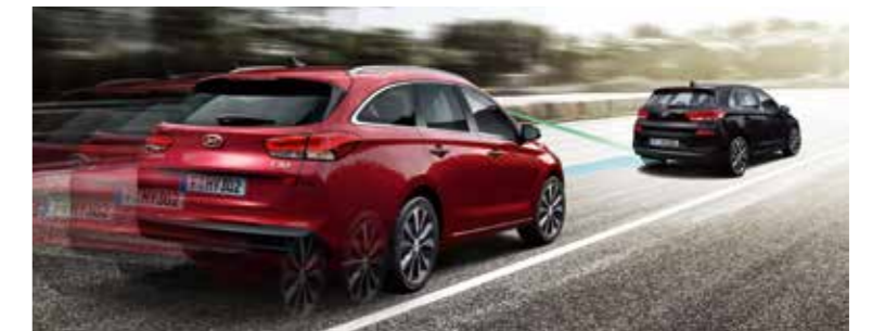
Systém autonómneho núdzového brzdienia (AEB) s funkciou rozoznávania chodcov Pedestrian Alert automaticky zabrzdí vozidlo čiastočnou alebo maximálnou intenzitou, ak hrozí riziko kolízie.