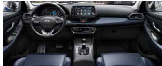
Dvojfarebný čierno-modrý interiér