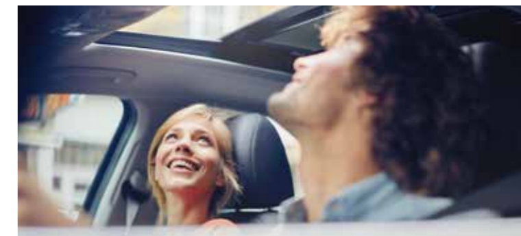
Panoramatické strešné okno

Harmonický dizajn kabíny dotvára pocit kvality, elegancie a veľkého priestoru, ktorý ďalej umocňuje veľké panoramatické strešné okno. Elektronická parkovacia brzda ovládaná tlačidlom uvoľnila miesto na stredovej konzole, v priestrannej kabíne je množstvo praktických odkladacích možností, perfektných pre rodinné expedície. Predné sedadlá môžu byť na želanie vyhrievané aj ventilované, pasažieri na zadných sedadlách majú k dispozícii vlastné výduchy na prívod teplého alebo schladeného vzduchu.