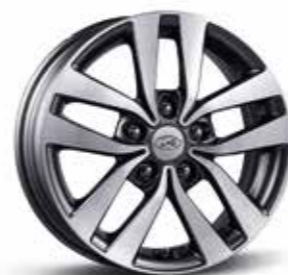
16" zliatinové disky s 5 dvojitými lúčmi (metalicky sivé)