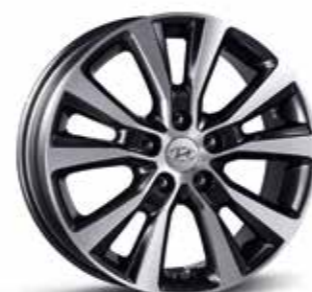
17" zliatinové disky s 5 dvojitými lúčmi (metalicky sivé)