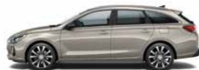
White Sand (metalizovaný lak)