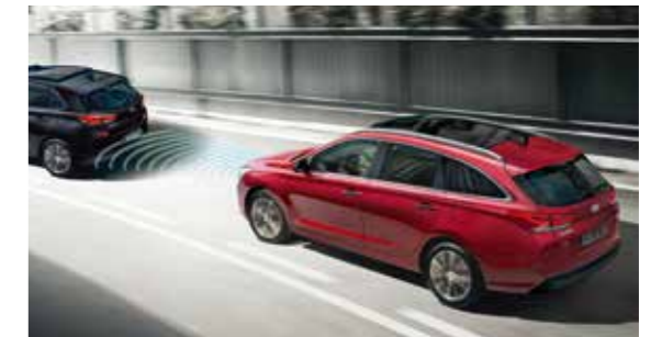
Adaptívny tempomat (ASCC) udržiava nastavený odstup od vozidla idúceho vpredu automatickým spomaľovaním alebo zrýchľovaním.