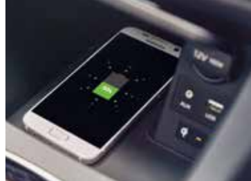
Bezkontaktné nabíjanie smartfónu* *Nekompatibilné smartfóny potrebujú adaptér na bezkontaktné nabíjanie.