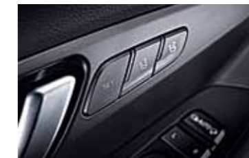
Elektricky nastaviteľné sedadlá s pamäťou