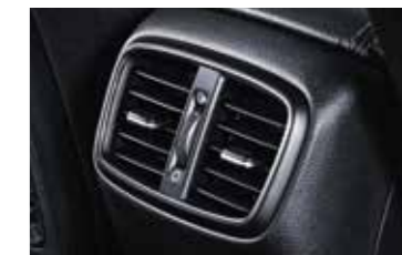
Výduchy ventilácie vzadu