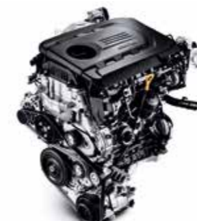
1.6 CRDi s výkonom 81/100 kW (110/136 k)