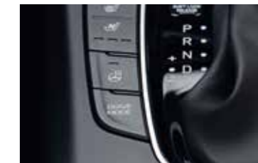
Drive Mode Select