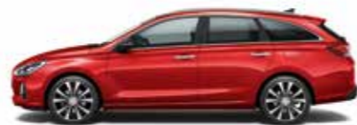
Engine Red (štandardný lak)