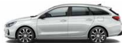
Platinum Silver (perleťový lak)