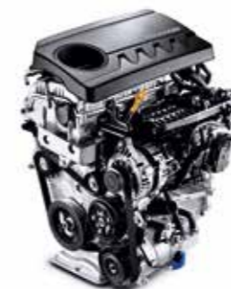
1.4 T-GDI s výkonom 103 kW (140 k)