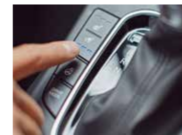
Ventilované kožené sedadlá