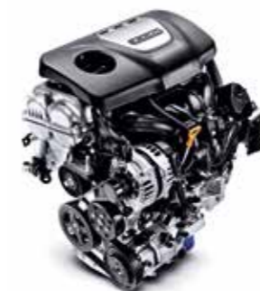
1.0 T-GDI s výkonom 88 kW (120 k)