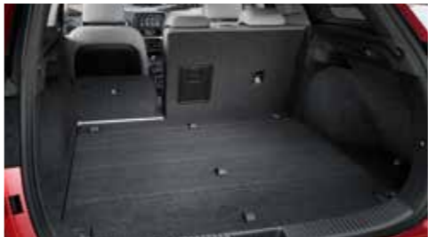
Operadlo zadného sedadla delené v pomere 60/40

Po otvorení dverí batožinového priestoru sa prejaví skryté talenty nového i30 kombi. Batožinový priestor s úctyhodným základným objemom 602 litrov sa dá sklopením operadla zadného sedadla zväčšiť na veľkorysých 1 650 litrov. Tým je nový i30 kombi ideálnym partnerom pre rodinu, na voľný čas alebo na pracovné využitie. Čokoľvek pred vás postaví bežný deň, vždy to zvládnete so štýlom.