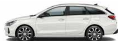
Polar White (štandardný lak)