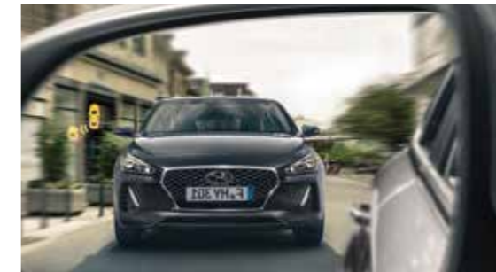
Systém monitorovania mŕtveho uhla (BSD) vizuálne a akusticky upozorňuje na vozidlá skryté v oblasti mŕtvych uhlov vonkajších spätných zrkadiel.

Každý člen posádky nového i30 kombi sa môže cítiť bezpečne. Systém na sledovanie únavy vodiča (DAA) monitoruje správanie vodiča a odhalí nastupujúcu únavu, ktorá má vplyv na bezpečnosť jazdy. K ďalším vyspelým bezpečnostným prvkom patria systém automatického núdzového brzdienia (AEB), adaptívny tempomat (ASCC), systém na automatické udržanie vozidla v jazdnom pruhu (LKAS).