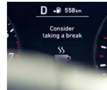
Systém na sledovanie únavy vodiča (DAA) odhalí nastupujúcu únavu vodiča a akusticky aj vizuálne ho upozorní, aby si urobil prestávku na odpočinok.