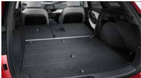
Veľký objem batožinového priestoru