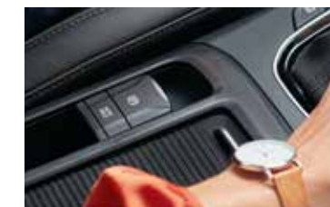
Elektronická parkovacia brzda