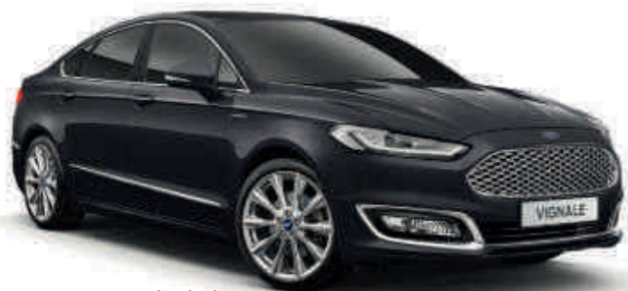
Vignale Black Metalická farba karosérie*