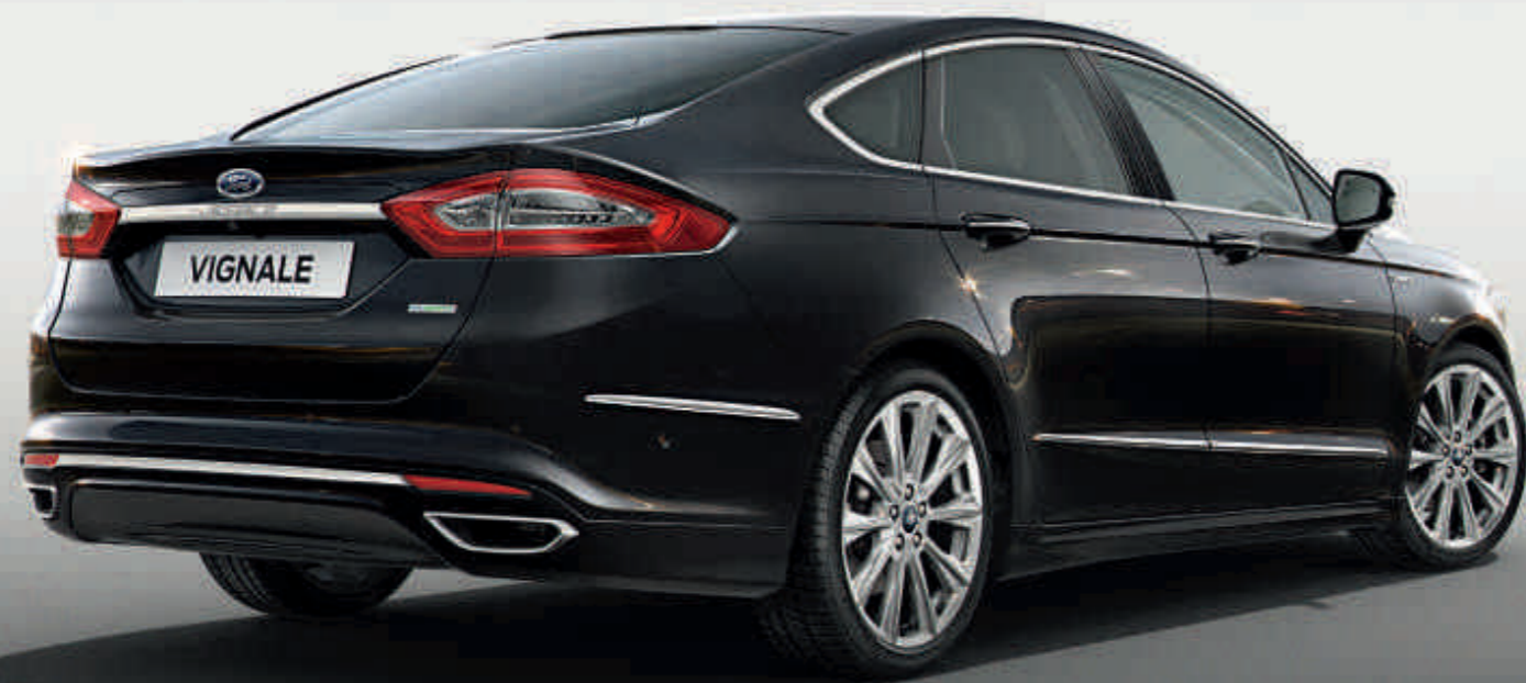
Ford Mondeo Vignale sedan.