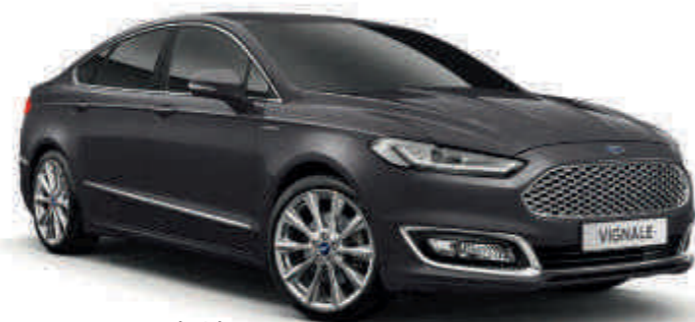
Vignale Silver Metalická farba karosérie*