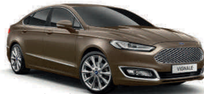
Vignale Nocciola Trojvrstvá metalická farba karosérie*