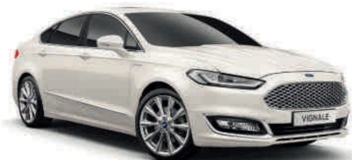
Vignale White Štvorvrstvá metalická farba karosérie*