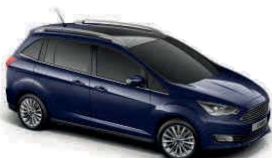
Blazer Blue Nemetalická farba karosérie