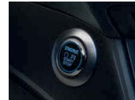
Štartovacie tlačidlo Ford Power Starter (Štandardná výbava)