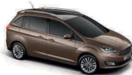
Caribou Metalická farba karosérie*