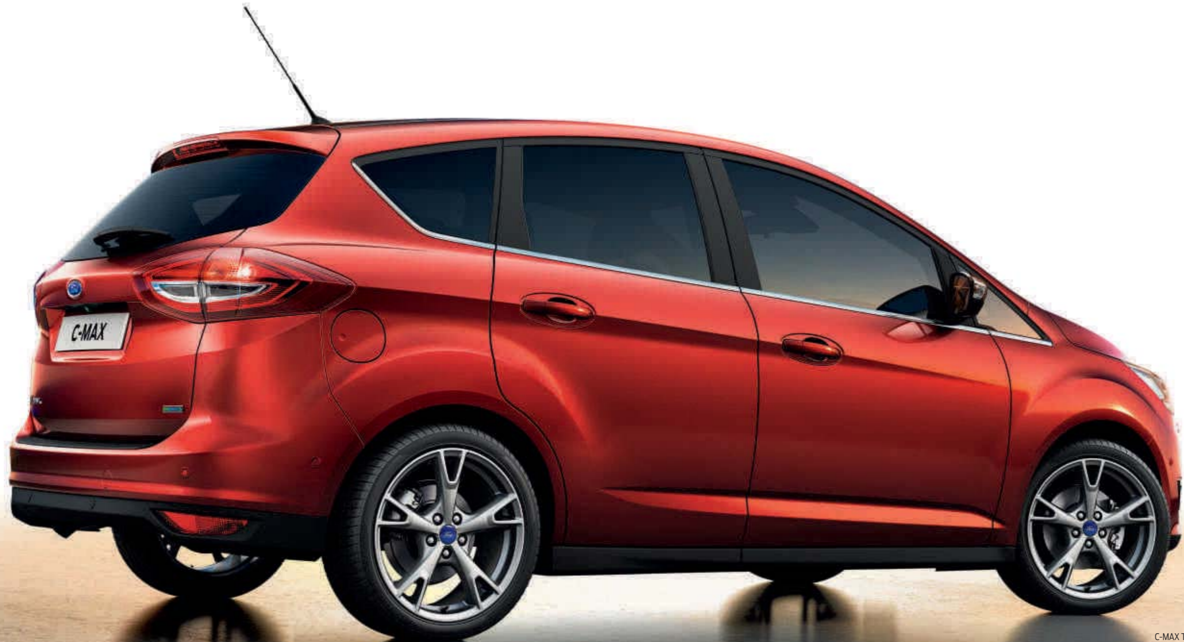
C-MAX Titanium v Red Rush s 18" 5x2-lúčovými diskami kolies z ľahkých zliatin (na pranie)