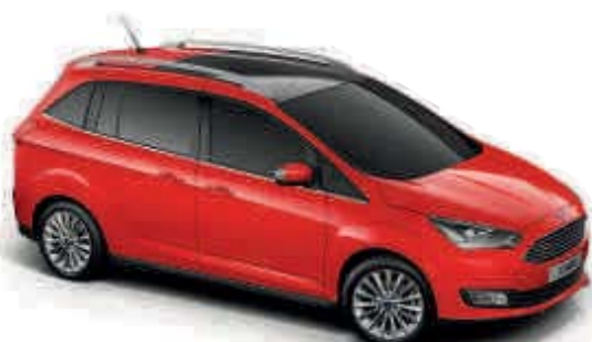
Race Red Nemetalická farba*