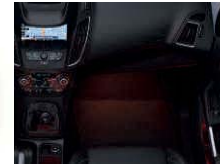
Tlmené osvetlenie interiéru (Štandardná výbava)

C-MAX 5 sedadiel Grand C-MAX 5+2 sedadiel