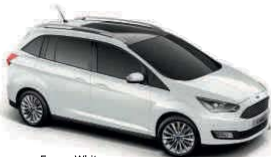
Frozen White Nemetalická farba*