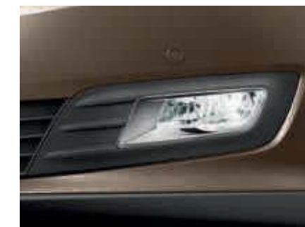
Predné hmlové svetlá s pochrómovaným olemovaním* (Štandardná výbava)