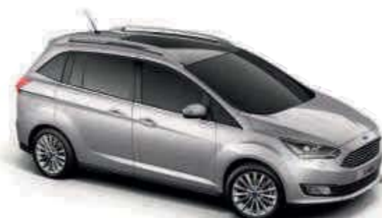
Moon dust Silver Metalická farba karosérie*