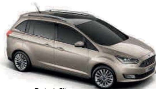
Tectonic Silver Metalická farba karosérie*