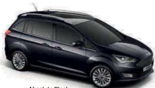
Absolute Black Metalická farba karosérie*