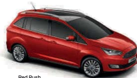
Red Rush Metalická farba karosérie*