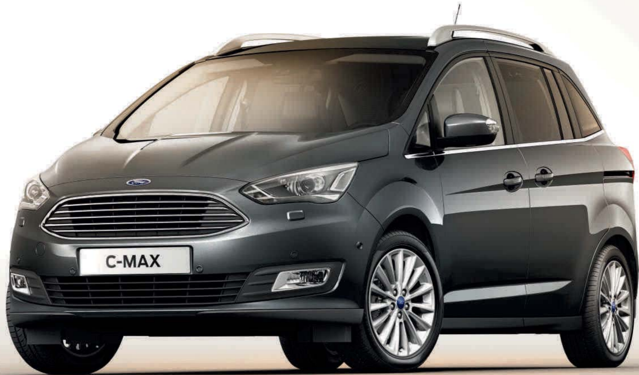
Grand C-MAX Titanium v Magnetic Grey s 17" 15-lúčovými diskami kolies z ľahkých zliatin (na pranie)