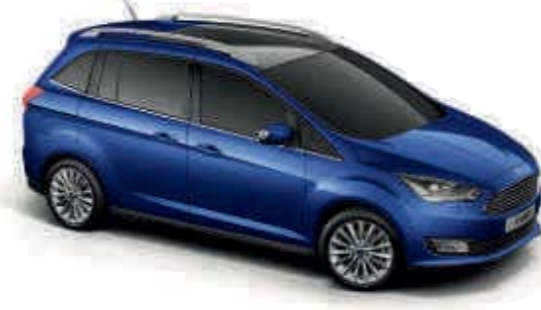
Deep Impact Blue Metalická farba karosérie*