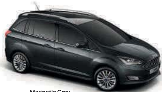
Magnetic Grey Metalická farba karosérie*