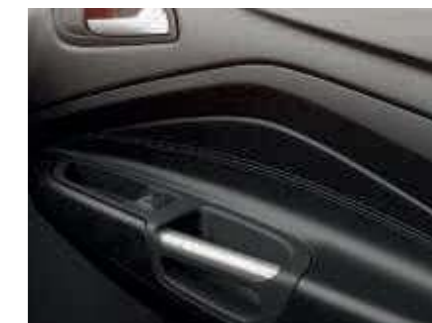
Luxusná výplň na dverách (Štandardná výbava)