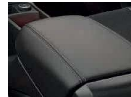
Opierka na ruku s výrazným švom (Štandardná výbava)

Naftové: 2,0 Duratorq TDCI (150k), 2,0 Duratorq TDCI (170k)